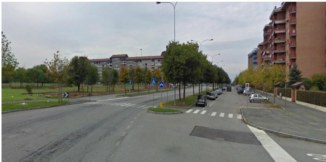
Foto n° 1: Vista C.so Puccini angolo via Donatello verso l'area di intervento