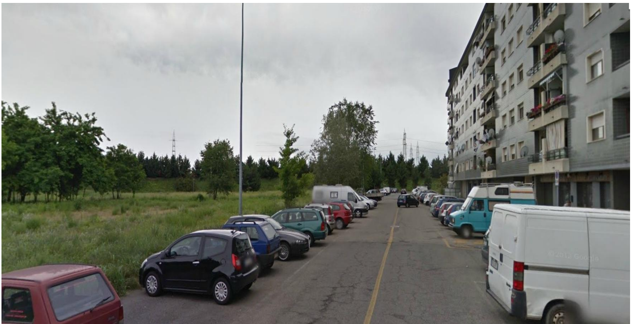
Foto n° 8: Vista via Verga verso Tangenziale verso l'area di intervento