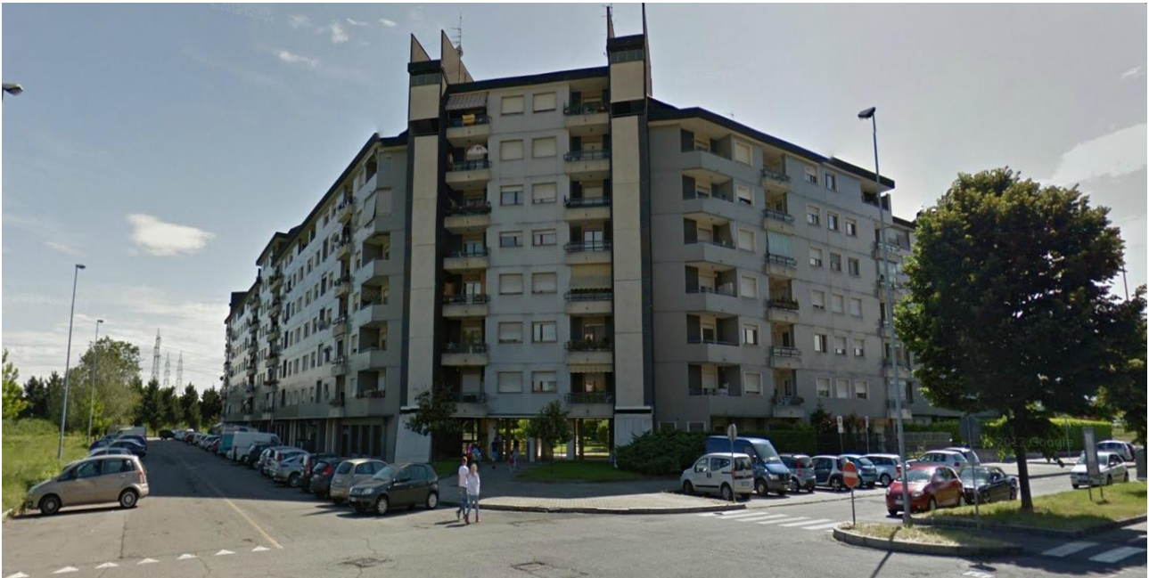
Foto n° 3: Vista C.so Puccini angolo via Verga verso edificio adiacente al lotto d'intervento