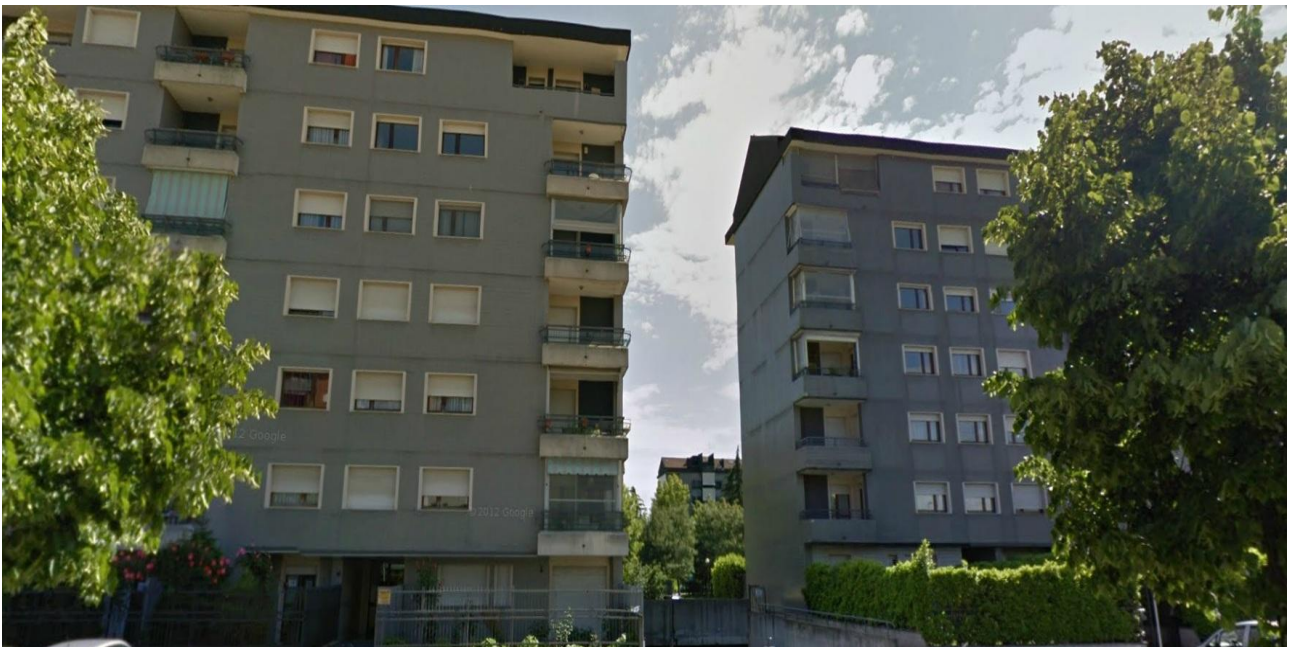
Foto n° 4: Vista C.so Puccini verso edificio adiacente al lotto d'intervento