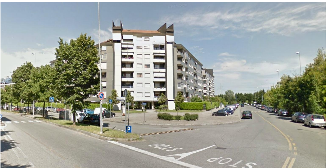
Foto n° 6: Vista C.so Petrarca angolo via Guicciardini verso edificio adiacente al lotto d'intervento