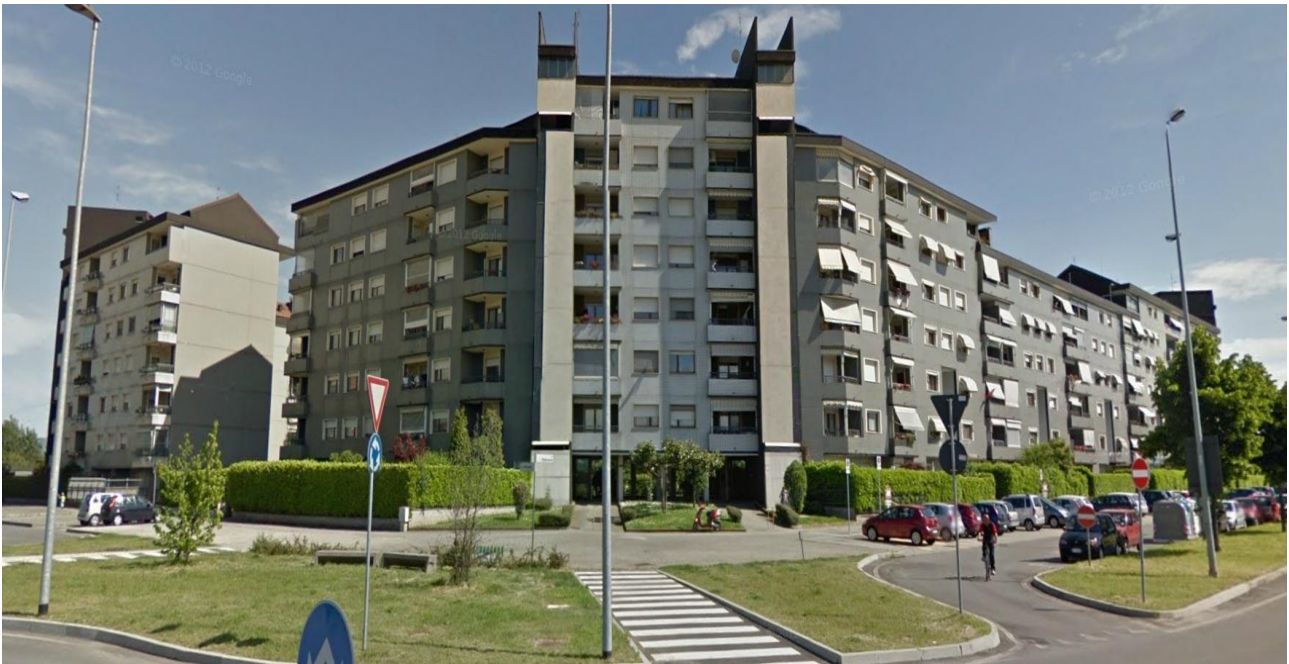
Foto n° 5: Vista C.so Puccini angolo C.so Petrarca verso edificio adiacente al lotto d'intervento