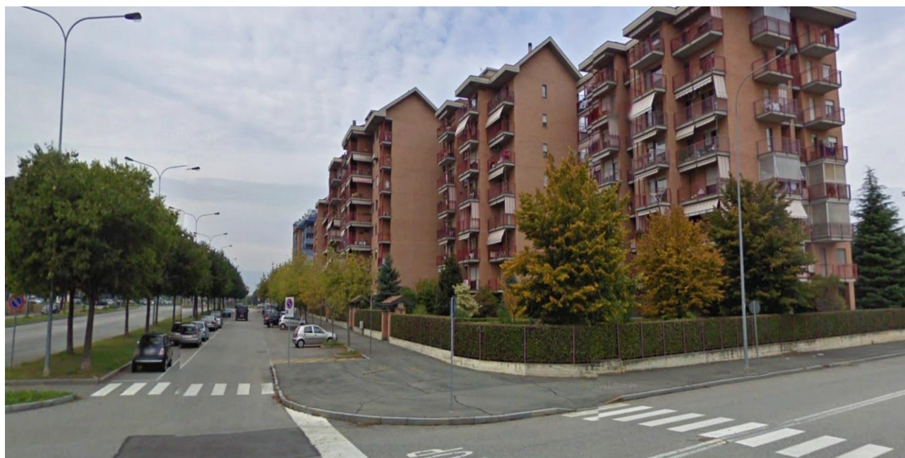
Foto n° 2: Vista C.so Puccini angolo via Donatello verso edificio adiacente al lotto d'intervento