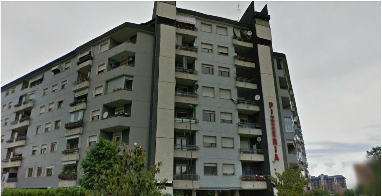
Foto n° 7: Vista via Guicciardini angolo via Verga verso edificio adiacente al lotto d'intervento